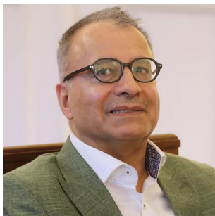
Amir Hassan Cheheltan

des Landes protestieren [ https://www.zeit.de/thema/iran ], haben den Nationalspielern vorgeworfen, sie zeigten sich mit dieser Protestbewegung nicht ausreichend verbunden. Die Protestierenden vertreten die Auffassung, alles, was den Anschein erweckt, das Leben in Iran verlaufe normal, spielt der Regierung in die Hände, die ihrerseits so tut, als seien die Proteste eine belanglose Ausnahme und von kurzer Dauer. Welcher Spieler aus Solidarität mit den Toten, die die Demonstrationen bisher gefordert haben, eine schwarze Armbinde getragen oder wer im Stadion zur Nationalhymne nur stimmlos die Lippen bewegt hat, war für die Aktivisten von höchstem Interesse, wurde mit Argusaugen beobachtet und hat in den sozialen Netzwerken zu heftigen Reaktionen geführt.